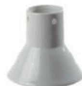
Codice: BACP Alloggiamento cuocipollo in argilla