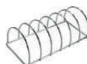
Codice: BACRLM Cuoci ribs in acciaio 304