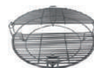
Codice: BAGRISD2LL Griglia 2 livelli acciaio inox 304 (mezzelune escluse)