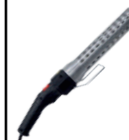
Codice: BACL Accendi carbonella elettrico T650° - 230V-50Hz / 2000W