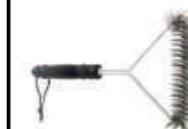
Codice: BACB Spazzola pulisci griglia con setole in acciaio 16x30 cm