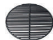
Codice: BACIGRIDL Griglia in ghisa