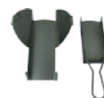
Codice: BAAEL Set raccoglieneri in acciaio 201