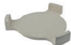
Codice: BASFL Piatto per cottura in ceramica cordierite