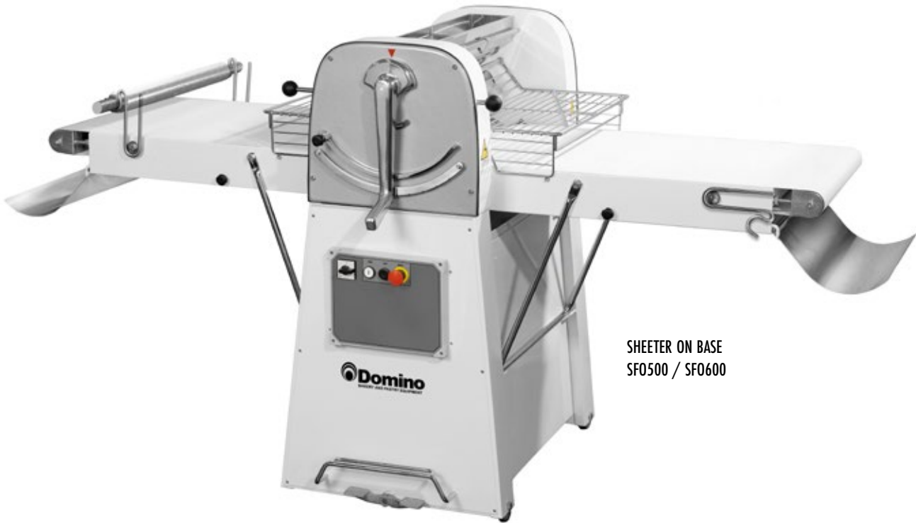
SHEETER ON BASE SFO500 / SFO600