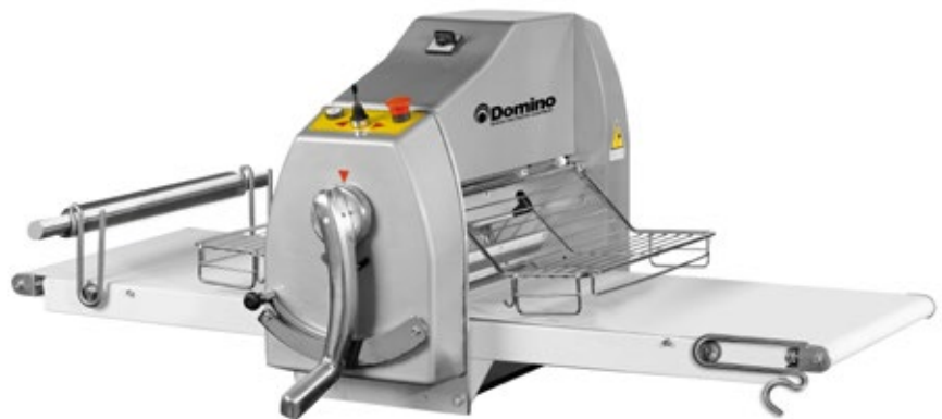
TABLE TOP SHEETER SFO500B